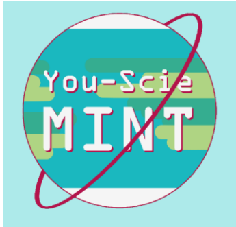
Logo von Young Scientists for Future